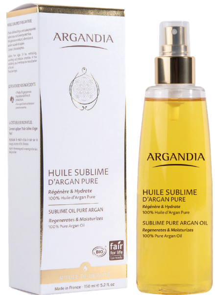
241008 150 ml - 5.1 fl.oz