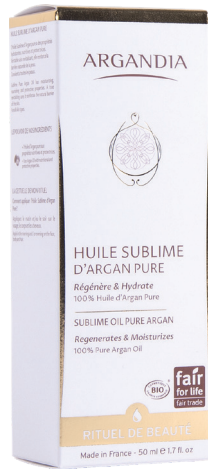
241001 50 ml - 1.7 fl.oz